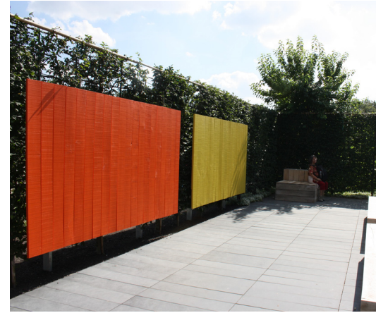
Jardim de recolhimento