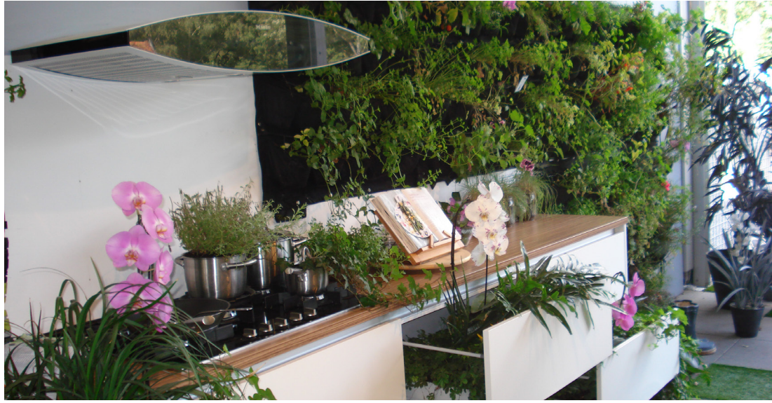
Interior repleto de plantas (cozinha)