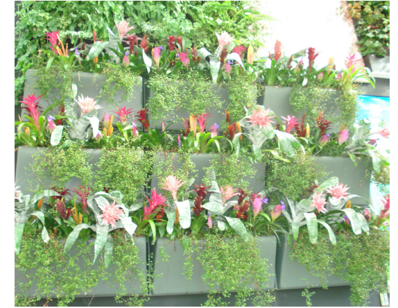
Jardim vertical com bromélias