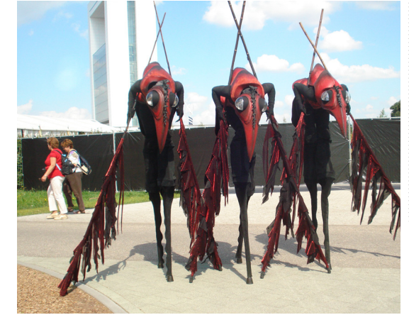
Animação de rua