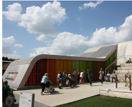
Pavilhão de Espanha