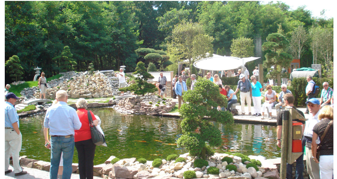
Lago carpas Koy