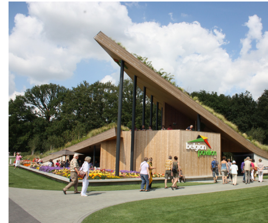
Pavilhão da Bélgica

Cada um dos temas tem os respectivos pavilhões e jardins em zonas próprias, todas separadas umas das outras por bosques autóctones. Como cenário para o magnífico palco central, estende-se um grande lago, que “abraça” uma grande parte do recinto. Saiba mais em: www.floriade.com e www.bloominholland.com