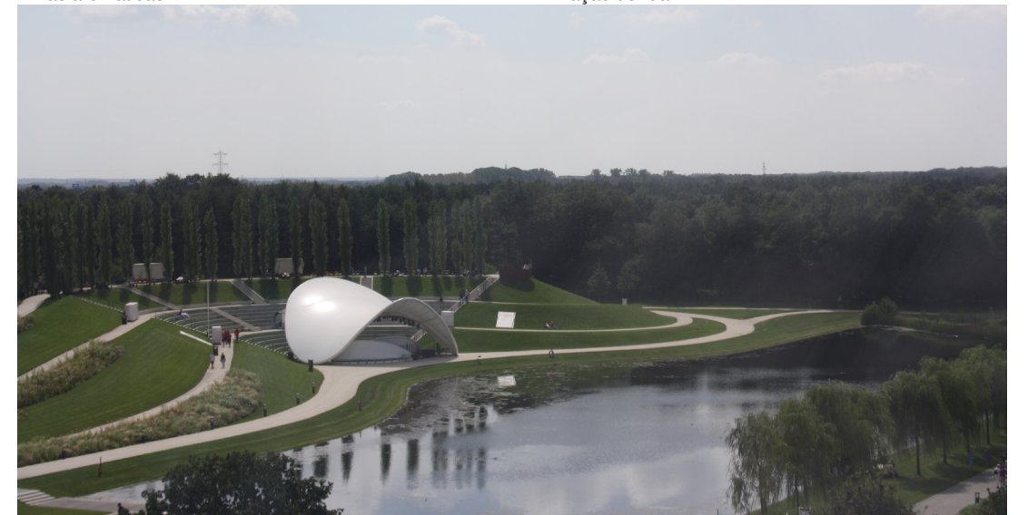
Anfiteatro e lago