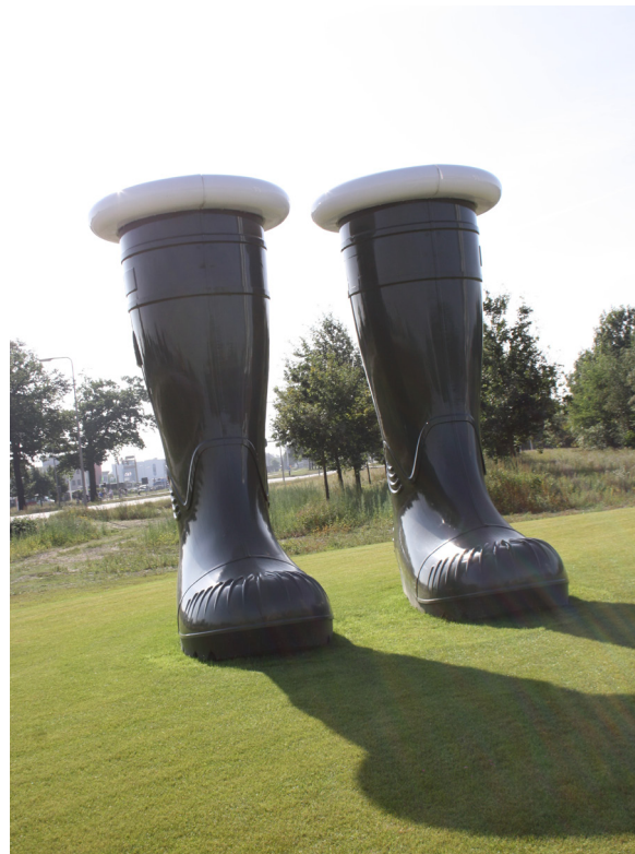
Na entrada do recinto