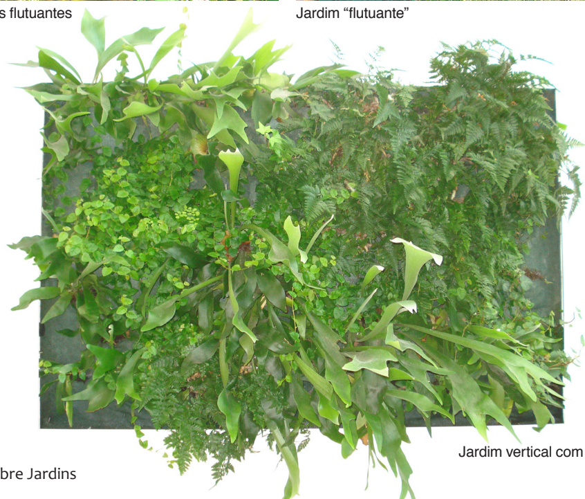
Jardim vertical com fetos