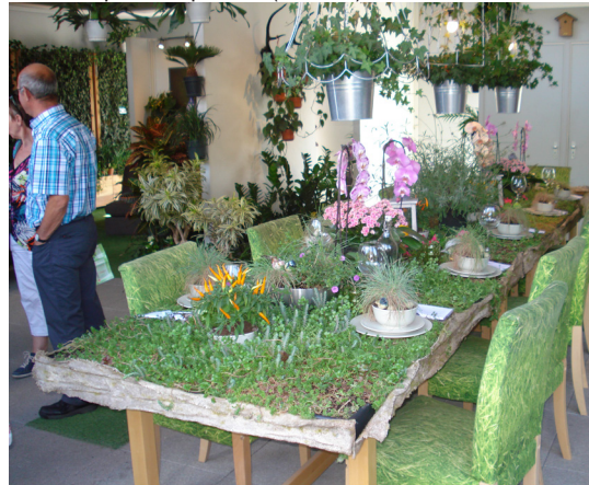
Interior repleto de plantas (sala)