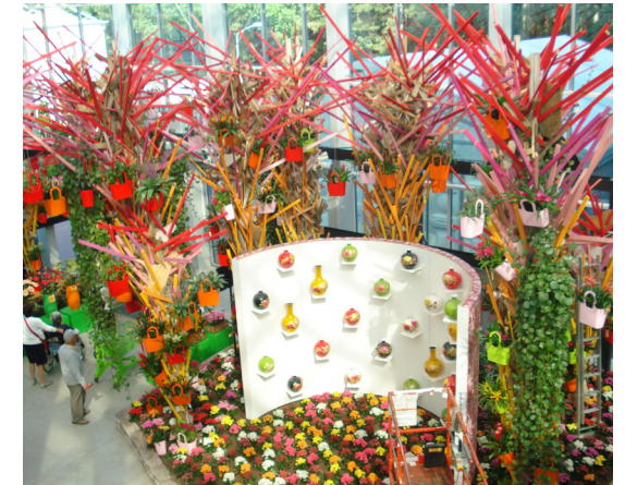
Display com tábuas coloridas e bromélias