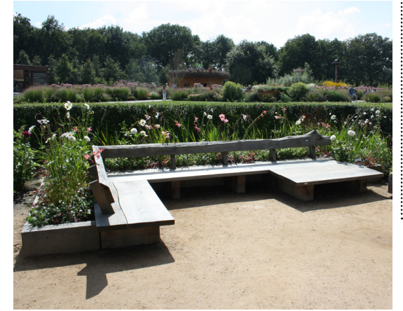
Observatório de rosas