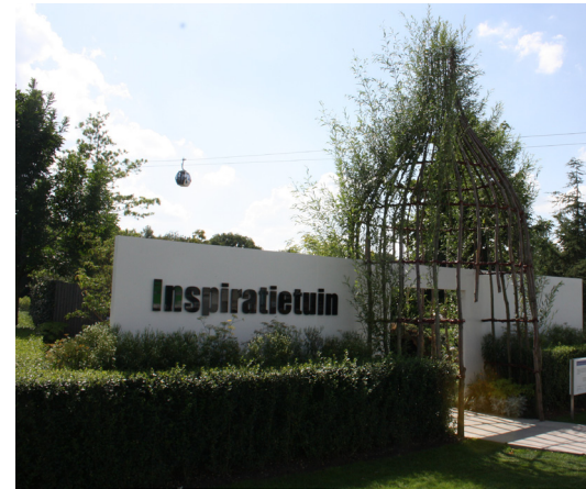
Aos prazeres da vida