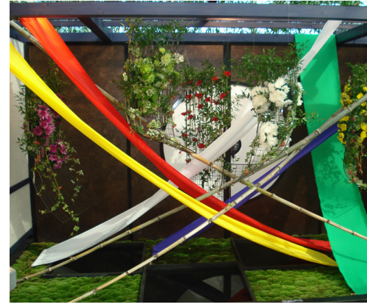
Display na Villa flora