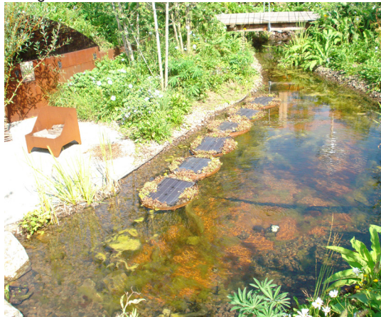
Painéis solares flutuantes