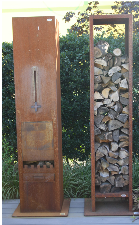
Lareira de exterior