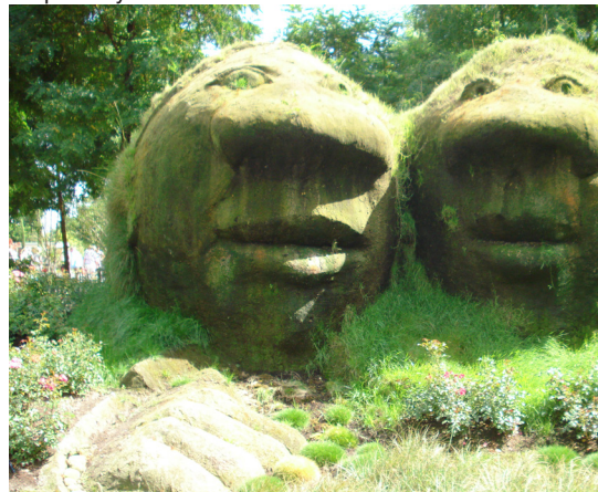
Cabeças de ogre