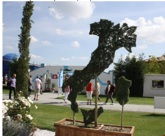
Pavilhão de Itália